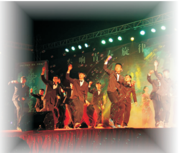
综合汇演舞蹈《印度舞》

“雏凤杯”语言类节目把艺术节的精彩魅力延续到底。《新白蛇传》（喜剧）好评如潮，剧情能与校园生活趣事无缝衔接，在场的欢笑声不绝于耳。《灰王子的故事》表演者演技大胆、台词诙谐、男女反串出演，如此具有看点的节目让晚会的热度持续升温。相声《智取威虎山》语言精湛，妙趣横生，最后以接近满分的成绩夺得一等奖的荣誉。